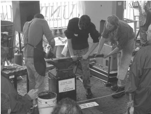
Smeden aan het werk te Nieuwkoop

Op vrijdag 26 en zaterdag 27 mei brachten de studenten van het atelier Smeedkunst een bezoek aan de smeedmanifestatie in Nieuwkoop.