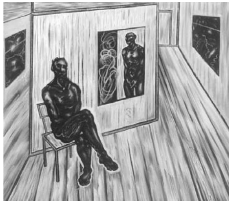
In de wachtzaal - Joris De Geest - Acryl op doek