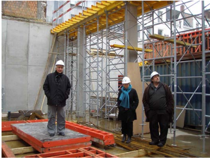
Enkele docenten Kaskadko op werkbezoek