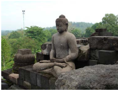
Borobudur-tempelcomplex, Indonesië, één van de door Kaskadko bezochte bezienswaardigheden tijdens de afgelopen paasvakantie

ATHENA TE ANTWERPEN vzw Dries 29 2000 Antwerpen www.academieantwerpendko.org athenvzw@gmail.com