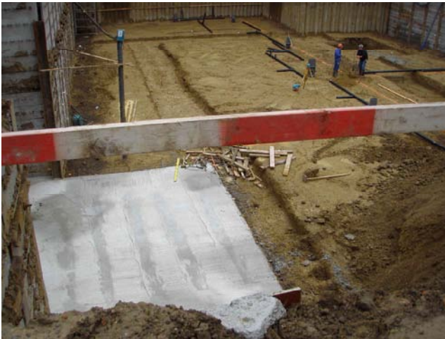
Ruwbouwwerken kelderverdieping - Het ingieten van de betonplaat

Volgens de laatste berichten zal op 7 februari 2008 de kelderverdieping gedicht zijn. Nog 302 werkdagen te gaan tot de eindafwerking!