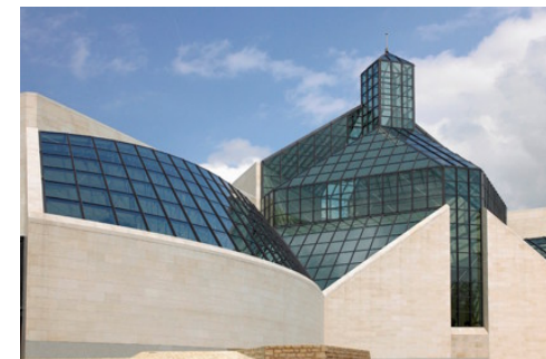
Museum Mudam Luxemburg