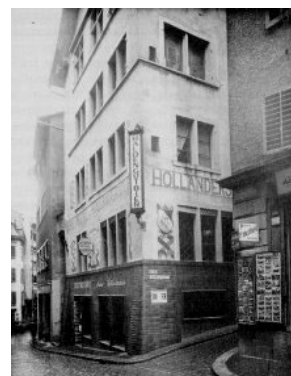
Cabaret Voltaire Zürich

INFORMATIEMOMENT dinsdag 18 maart 2008, 20u, Aula Pand (gelijkvloers, naast Wintertuin)