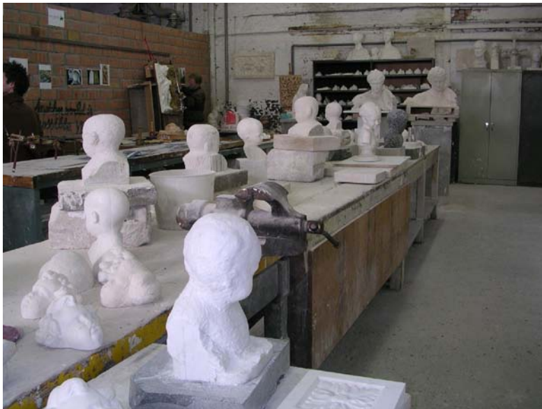
Het atelier Kunstambachten Steen-Beeld - opendeur 2006

Campus Mutsaardstraat 31, 2000 Antwerpen: edelsmeden, keramiek, vrije en toegepaste grafiek, beeldhouwen, fotokunst, schilderkunst