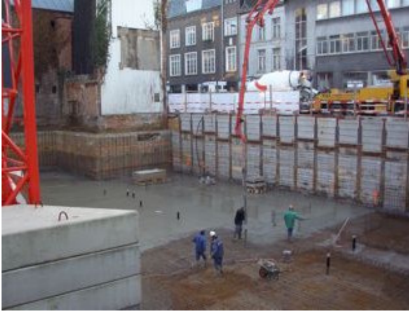
ruwbouwwerken kelderverdieping wapening en beton algemene grondplaat